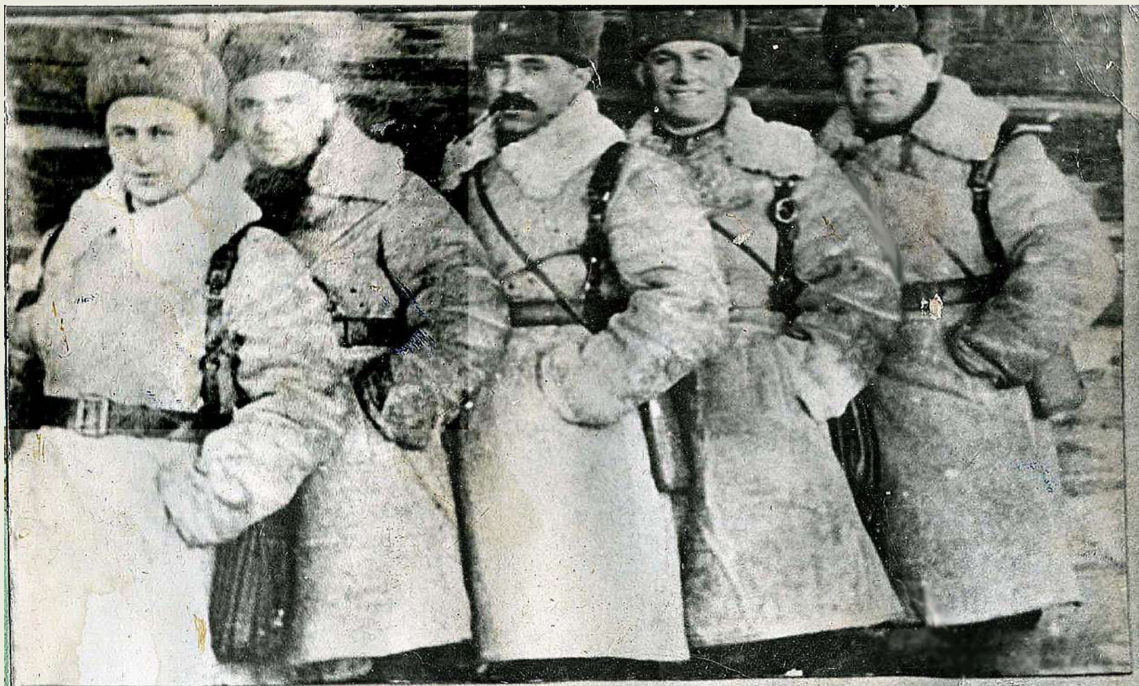
Группа работников штаба дивизии