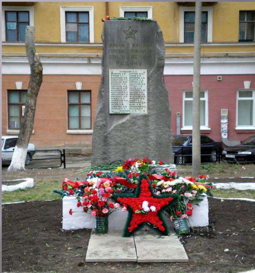
Памятник погибшим офицерам 3-й гвардейской стрелковой дивизии