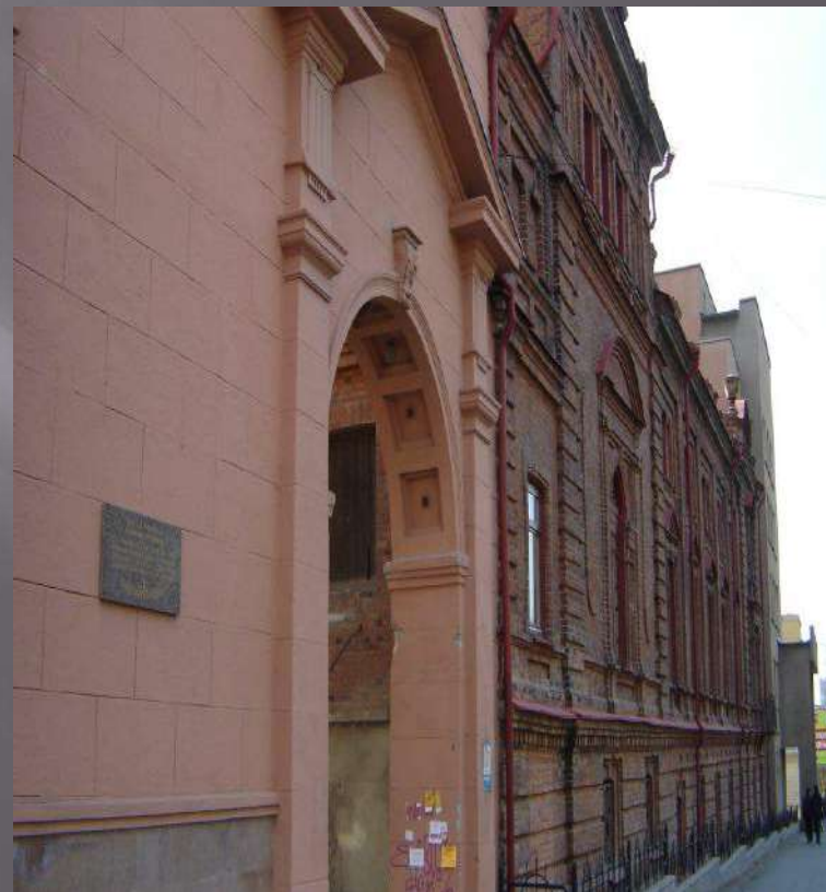
Здание штаба 153 стрелковой дивизии Г. Свердловск